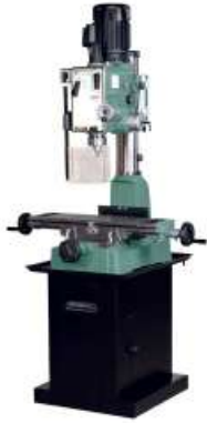
Montré avec le support optionnel (#75-885)