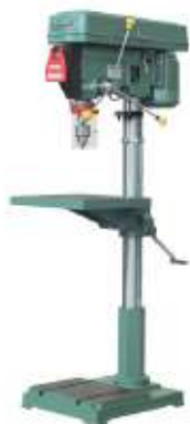
Modèle de plancher