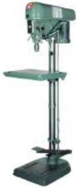
Modèle de production