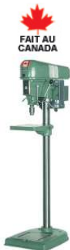
Modèle de plancher