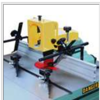
Système d'ajustement de guide de luxe