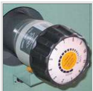
Grand bouton de contrôle de la vitesse variable