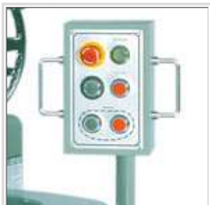
Panneau de contrôle facile d'accès