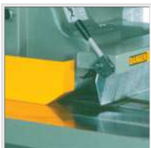
Glissières en V de précision assurant des coupes longitudinales droites de haute précision