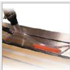
Couvre-lame transparent avec auto-diviseur et doigts anti-retour