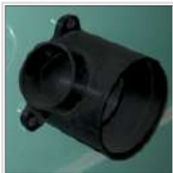
Sortie de poussière intégrée au cabinet et au couvre-lame