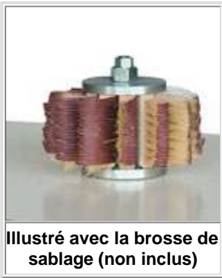
Illustré avec la brosse de sablage (non inclus)