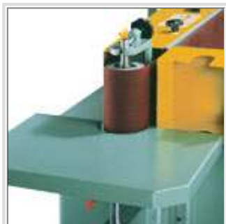
Table auxiliaire pour le ponçage des pièces à formes arrondies

LA TÊTE EN ENTIER (PAS SEULEMENT LA COURROIE) MONTE ET DESCEND