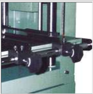
Systeme de guide ajustable inclus