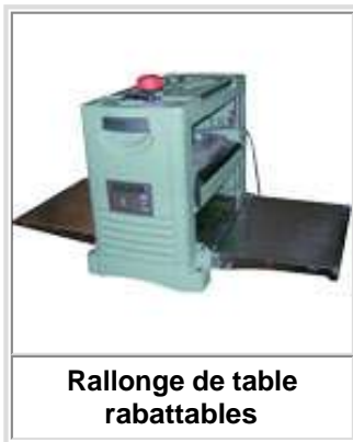
Rallonge de table rabattables