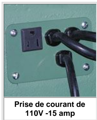
Prise de courant de 110V -15 amp