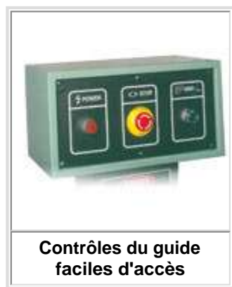
Contrôles du guide faciles d'accès