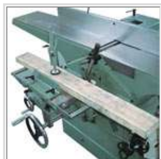
Attachement pour mortaisage amovible