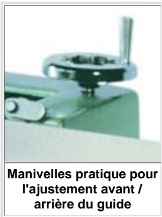
Manivelles pratique pour l'ajustement avant / arrière du guide