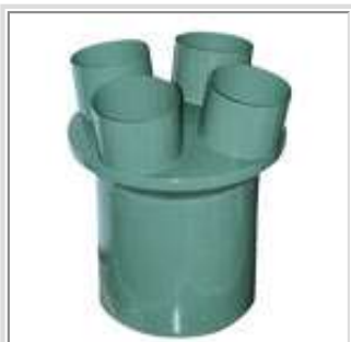
4 entrées de 5" sur l'entrée principale de 10"