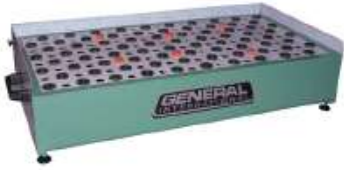
TABLE D'ASPIRATION PORTATIVE

Prise de 4" pour branchement au capteur de poussière, pour aspirer la poussière de ponçage directement au-dessus de la table.