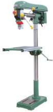
Modèle de plancher