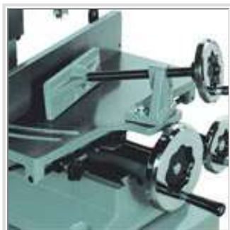
Guide pivotant ajustable