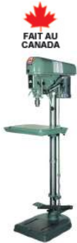
Modèle de production