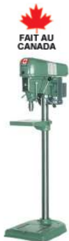
Modèle de plancher