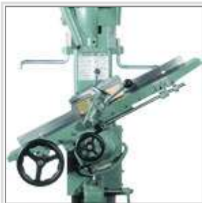
Table inclinable à 45° (gauche/ droite)

Table en fonte d'acier usinée avec précision, montée sur des glissières avec clavettes ajustables.