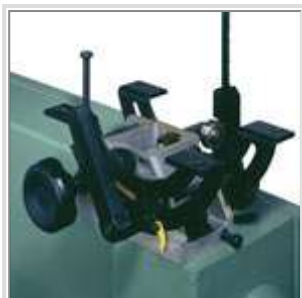
Support de la table robuste