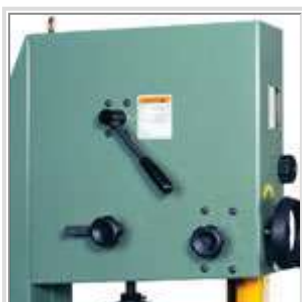
Changement de la me rapide