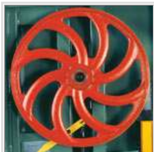
Roues en fonte d'acier équilibrées