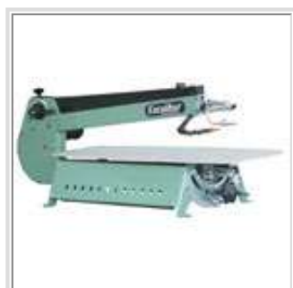
Monter ou descendre la position de la lame