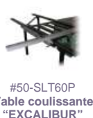
#50-SLT60P Table coulissante "EXCALIBUR"