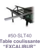
#50-SLT40 Table coulissante "EXCALIBUR"