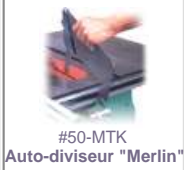
#50-MTK Auto-diviseur "Merlin"