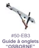
#50-EB3 Guide à onglets "OSBORNE"